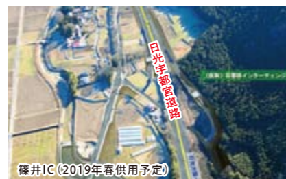
篠井IC (2019年春供用予定)