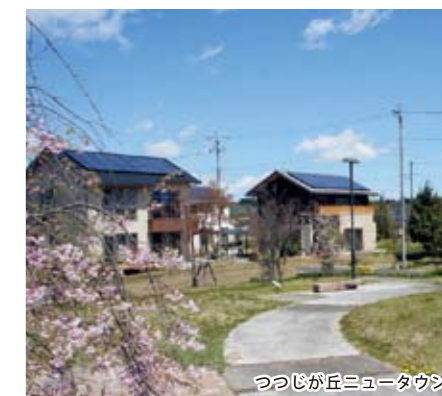
つつじが丘ニュータウン

県営住宅の管理 (県からの受託) 公社賃貸住宅の管理 ● マロニエハイツ今泉 (宇都宮市) ● マロニエハイツ陽北A/B棟 (宇都宮市) 賃貸住宅の管理 (民間からの受託)