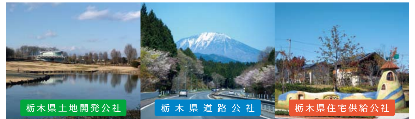
栃木県土地開発公社