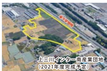
上三川インター南産業団地 (2021年度完成予定)