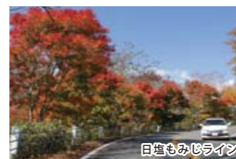
日塩もみぢライシ