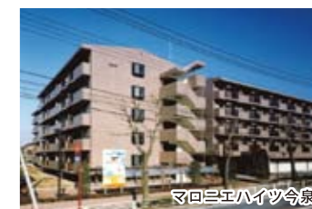
マロニエハイツ今泉