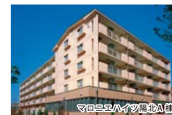
マロニエハイツ陽北A棟