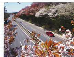
●日光宇都宮道路 (春)