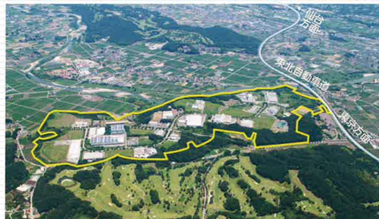
●宇都宮西中核工業団地

《実績》北関東自動車道、国道119号 (宇都宮北道路)、なかがわ水遊園、とちぎ海浜自然の家、宇都宮北高校