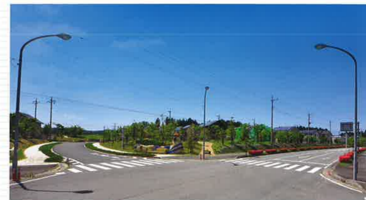
●つつじが丘ニュータウン