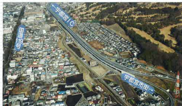
●国道119号宇都宮北道路