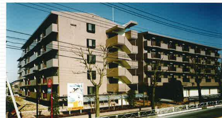
●マロニエハイツ今泉