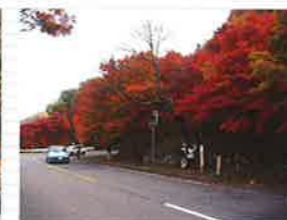
●日塩みじライン (秋)