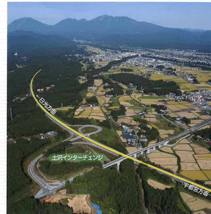
●日光宇都宮道路と土沢インターチェンジ