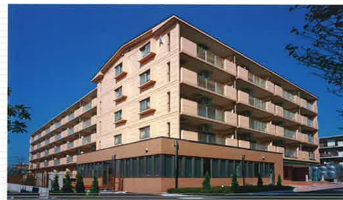
●マロニエハイツ陽北A棟